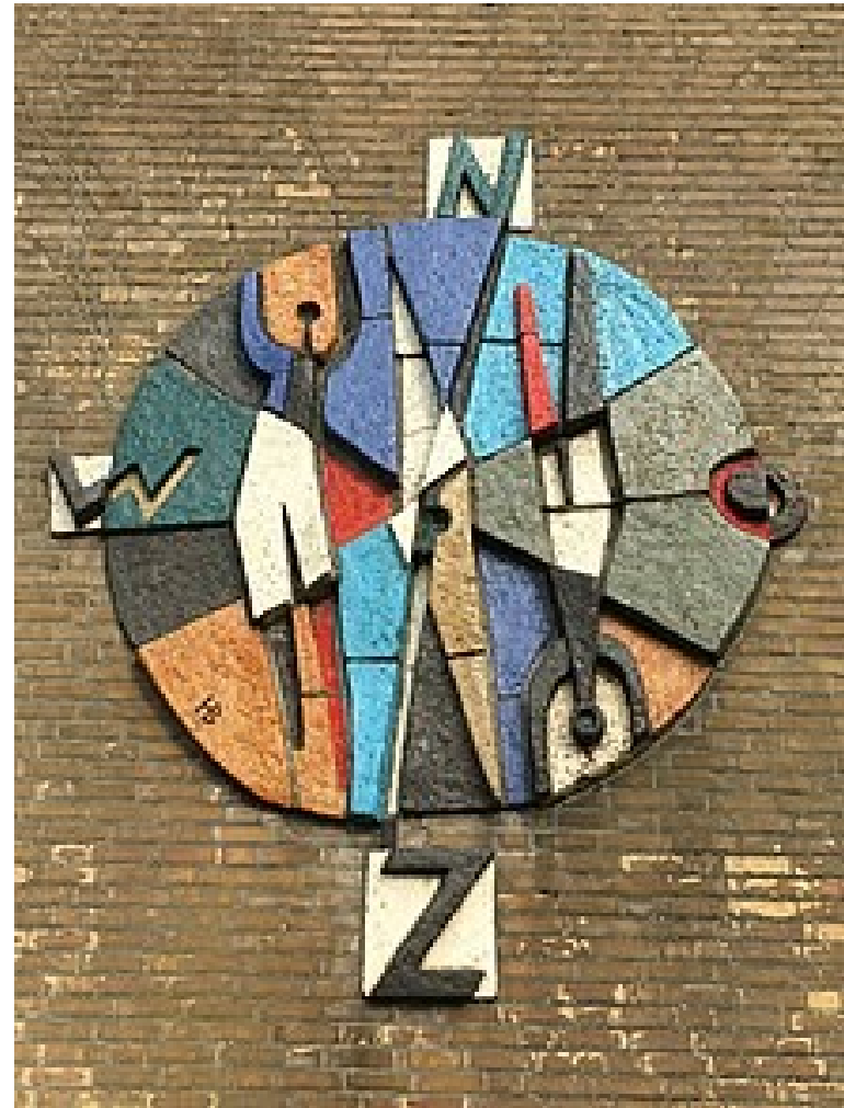
Wijkcommissie Kerkakkers, uw kompas in de wijk

Samen zijn wij hier zuinig op. U kunt ze vinden naast onze publicatieborden.