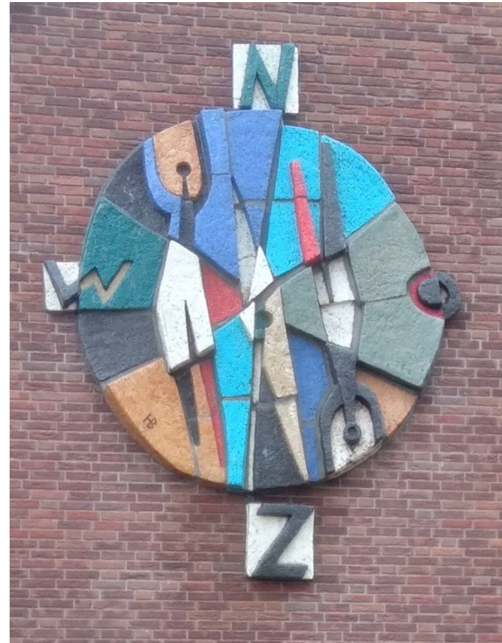
Wijkcommissie Kerkkakers, uw kompas in de wijk

Stichting Wijkcommissie Kerkkakers secretariaat: Doctor Ariënsstraat 20, Valkenswaard e-mail: secretariaat@wijkcommissiekerkakers.nl telefoon: 06 412 34 138, bestuur: 06 422 49 471 www.wijkcommissiekerkakers.nl