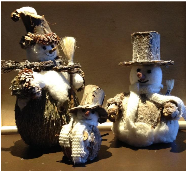
Een actief, gezond en voorspoedig 2018 namens de wijkcommissie Kerkakkers